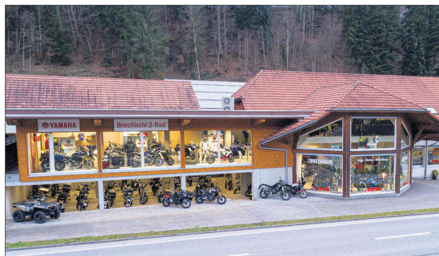
Die Brechbühl 2-Rad AG, die dieses Jahr von der zweiten Generation übernommen wird, hat ihren Geschäftssitz in Holzmatt, Eggwil.