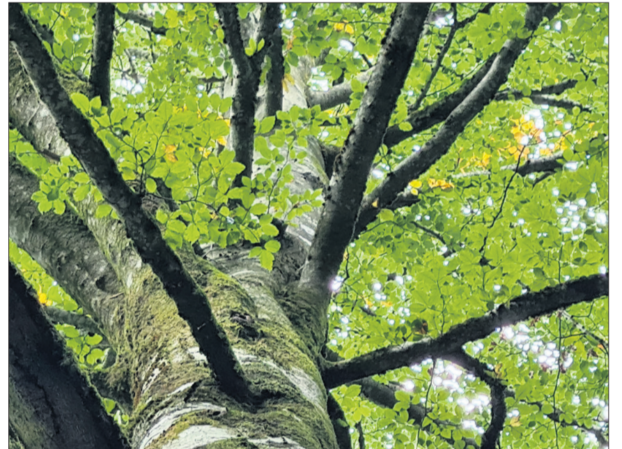
Auch die geschätzt 190-jährige Rotbuche «Schraubfundament» im Änzigrund wartet noch auf ihre Patin oder ihren Paten.