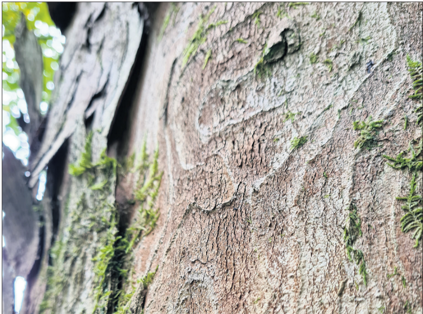
Der ungefähr 145-jährige, 25 Meter hohe Berg-Ahorn «Relief» im Änzigrund in Fankhaus hat bereits einen Paten.