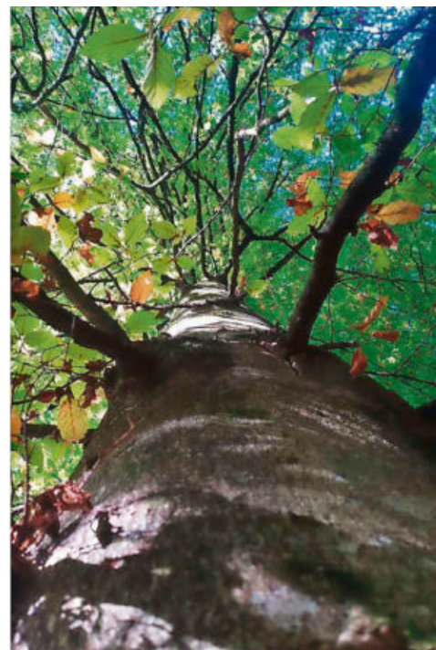
Sie heissen Casablanca, Kassiopeia und Elektra: 3 der 15 Bäume, für die man in Wila neu eine Patenschaft abschliessen kann.

Verein ein Modell, das Waldeigentümer davon abhalten soll, die ökologisch wertvollen Bäume zu fällen und das oft minderwertige Holz zu verkaufen.