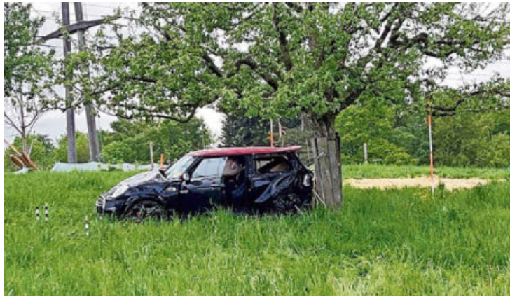
Die wilde Fahrt endete an einem Baum.

Der Lenker eines Mini Cooper, der an einem Nachmittag im Mai 2023 von Ottikon (Gossau) nach Wetzikon unterwegs war, war einer zivilen Patrouille der Kantonspolizei wegen seiner unsicheren Fahrweise aufgefallen. Die Polizisten setzten sich deshalb mit ihrem Fahrzeug hinter den Kleinwagen. Was sie kurz darauf sahen, dürften sie kaum geglaubt haben – da sie es filmten, ist es aber bestens belegt.